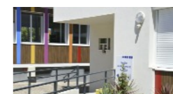
Service de Placement Familial

a pour mission le suivi social et médico-social de personnes adultes handicapées et de personnes âgées placées chez des particuliers et pour lesquelles un accueil familial constitue une alternative à l'hébergement collectif ou au maintien à domicile.