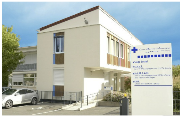
Siège social - 17 rue Pierre Doussinet à Clermont-Ferrand