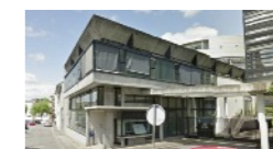
Service Mandataire Judiciaire à la Protection des Majeurs de Moulins, Montluçon, Vichy

a pour mission de protéger les personnes et les biens qui leur sont confiés, et engage un ensemble de mesures destinées à défendre, garantir et préserver une personne reconnue vulnérable.