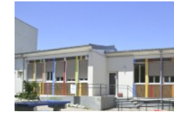
Service Accompagnement Médico-Social pour Adultes Handicapés

s'adresse aux personnes fragilisées par la maladie, acceptant un accompagnement afin de bénéficier d'un suivi médical régulier et acquérir plus d'autonomie.