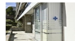
Service Mandataire Judiciaire à la Protection des Majeurs de Chamalières

a pour mission de protéger les personnes et les biens qui leur sont confiés, et d'engager un ensemble de mesures destinées à défendre, garantir et préserver une personne reconnue vulnérable.