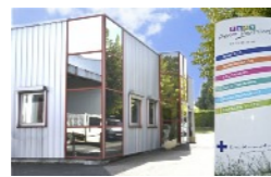
Centre Pierre Doussinet

La Croix-Marine Auvergne-Rhône-Alpes a pour but d'assurer, la protection ainsi que l'entraide psychologique et sociale, en faveur des personnes handicapées par déficience intellectuelle, par maladie mentale ou souffrant de troubles psychologiques avérés, ainsi que l'accompagnement des personnes défaiillantes, face aux actes de la vie courante et plus généralement de toute personne en difficulté sociale.