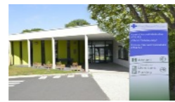
Foyer d'Accueil Médicalisé

est un Établissement et Service d'Aide par le Travail agréé pour 101 travailleurs handicapés. L'ESAT intervient dans les domaines d'activités variés : routage, façonnage, numérisation, espaces verts, sous-traitance.