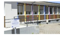
Service d'Accompagnement à la Vie Sociale

s'adresse à des personnes adultes handicapées psychiques résidant dans le Puy-de-Dôme. Le Service vise à maintenir-développer un certain degré d'autonomie dans divers domaines de leur quotidien.