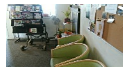
Groupe d'Entraide Mutuelle

accueille des personnes adultes en situation de handicap mental et/ou psychique stabilisé faisant preuve d'autonomie physique.