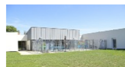
Maison d'Accueil Spécialisée

offre à toutes les personnes en souffrance psychique la possibilité de partager des moments de convivialité autour d'une ou plusieurs activités.