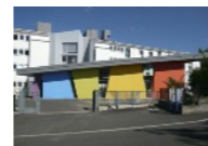
Maison de Retraite Spécialisée

est destinée aux personnes âgées de plus de 60 ans, n'ayant plus leur place en service de psychiatrie active et ne pouvant bénéficier de séjour dans diverses institutions protégées.